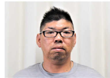
やしおとびしおだいかい 八潮飛潮太鼓会